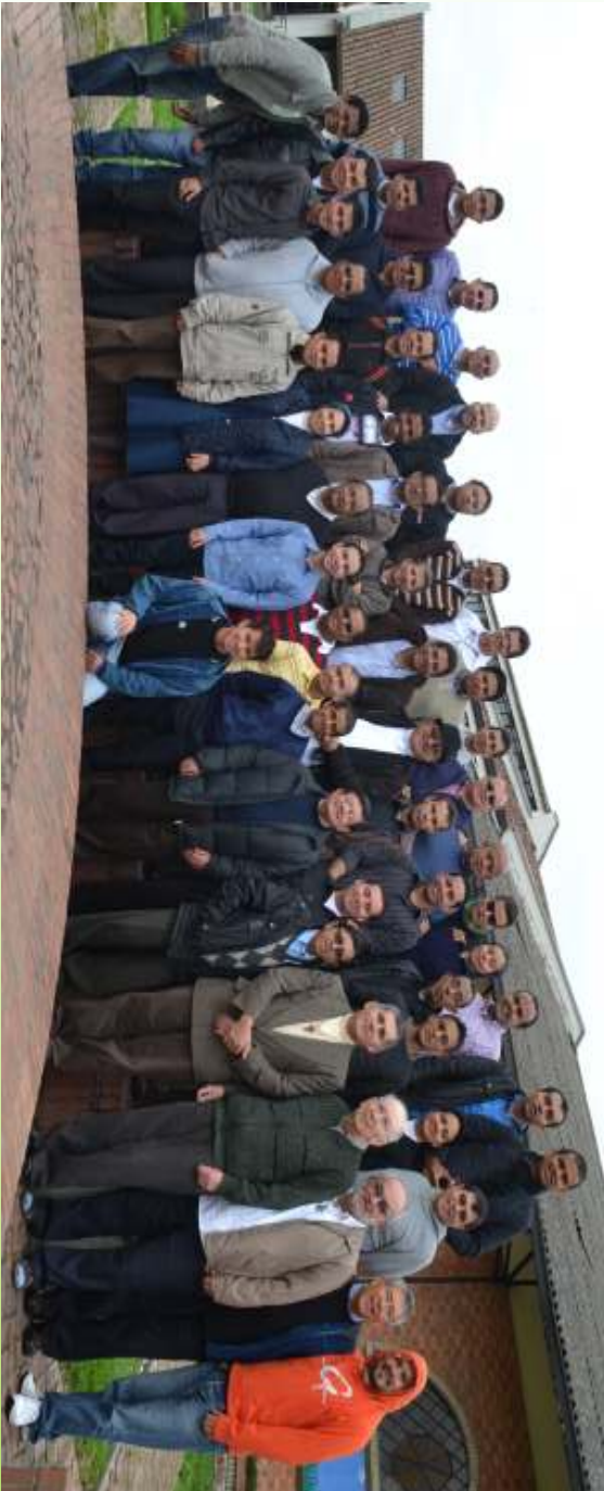
IV Encuentro de Formación de Formadores Funza - Colombia